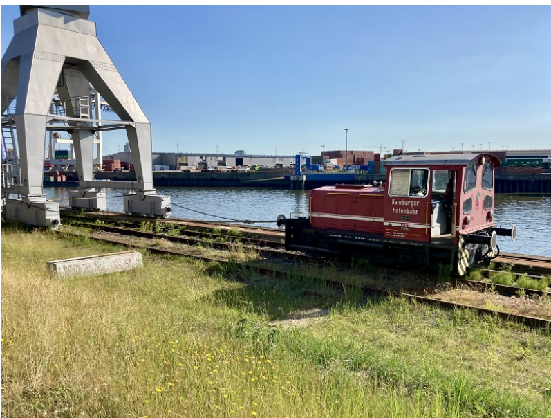
...der Stiftung die Hafenkräne zu verschieben, um Platz für die Peking zu schaffen