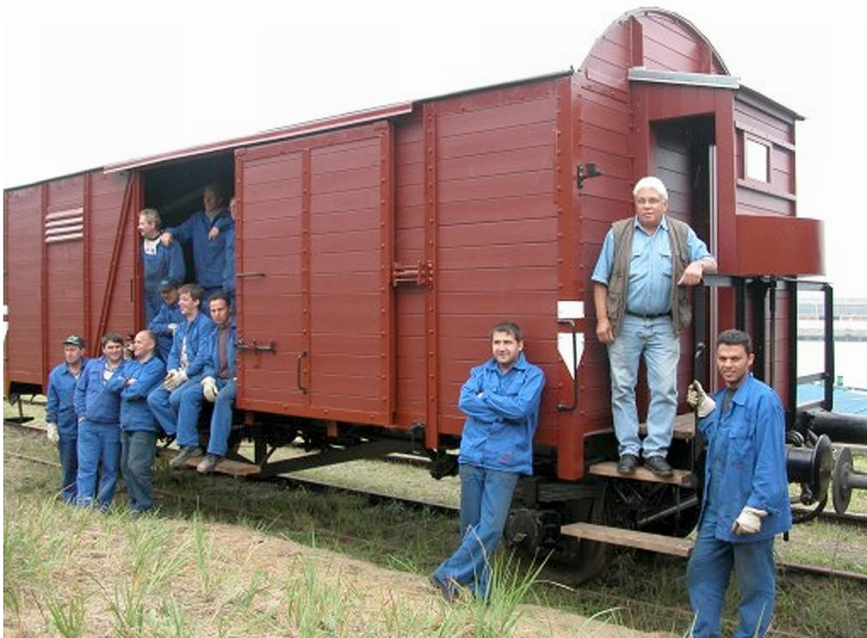
Der Hafentrupp von JiA (Jugend in Arbeit e.V.) vor dem ersten Grundinstand