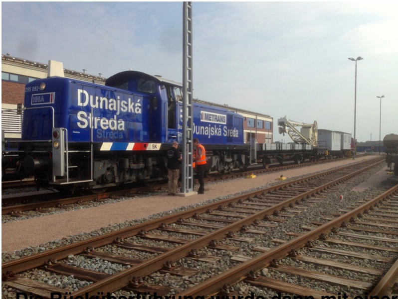
Die Rücküberführung wurde dann mit einer moderneren Lok realisiert