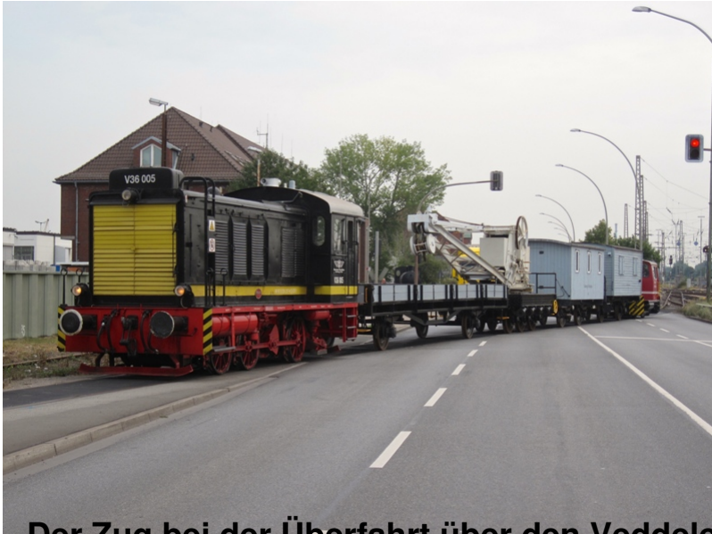
Der Zug bei der Überfahrt über den Veddeler Damm