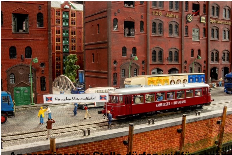
An prominenter Stelle dürfen wir für ehrenamtliche Triebwagenführer und weitere