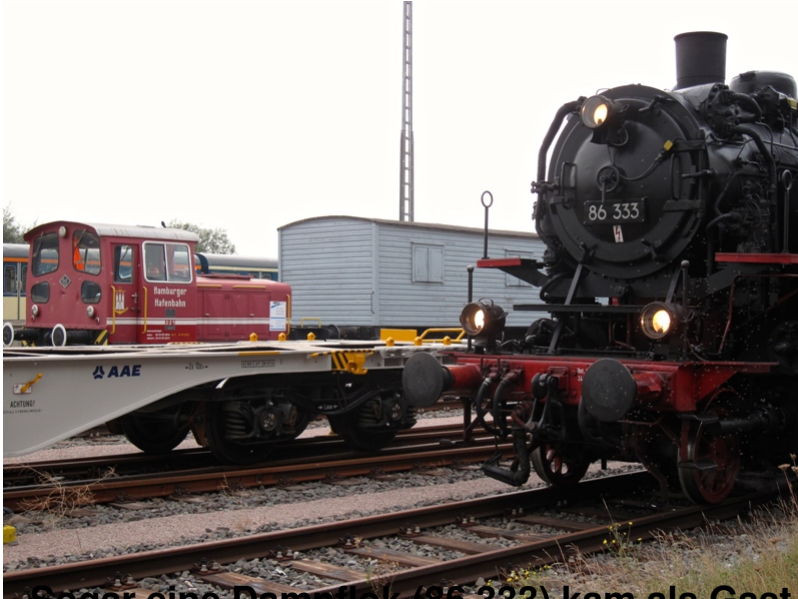
Sogar eine Dampflokom (86 333) kam als Gast vorbei