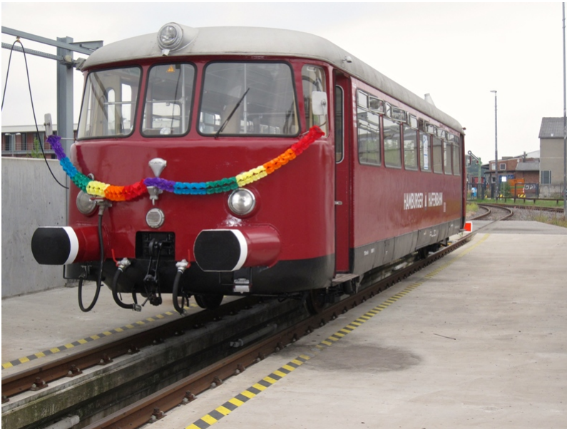
Zum Jubiläum konnte unser Schienenbus mit HU fertiggestellt werden und war