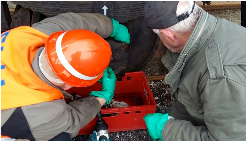
Nach erneuter Sturmflut im Oktober 2017 müssen nun alle Lager geöffnet und ent