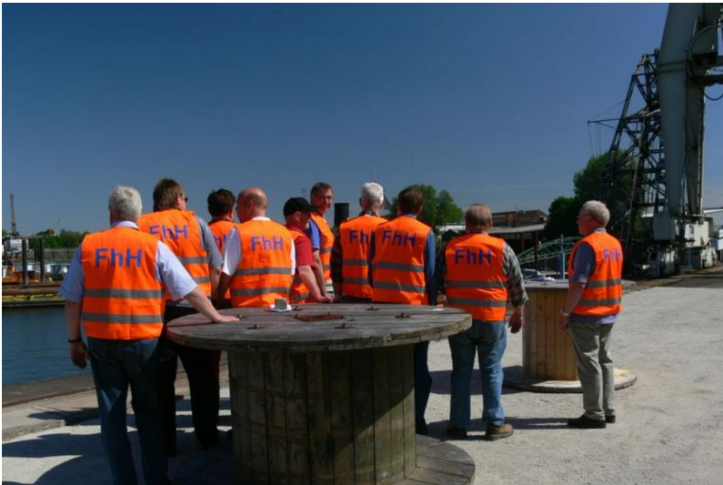
...und werden stolz vorgeführt