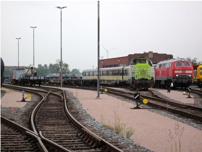
Auf dem Betriebsgeländer der Hafensbahn stehen mehrere Züge als Anschauungs