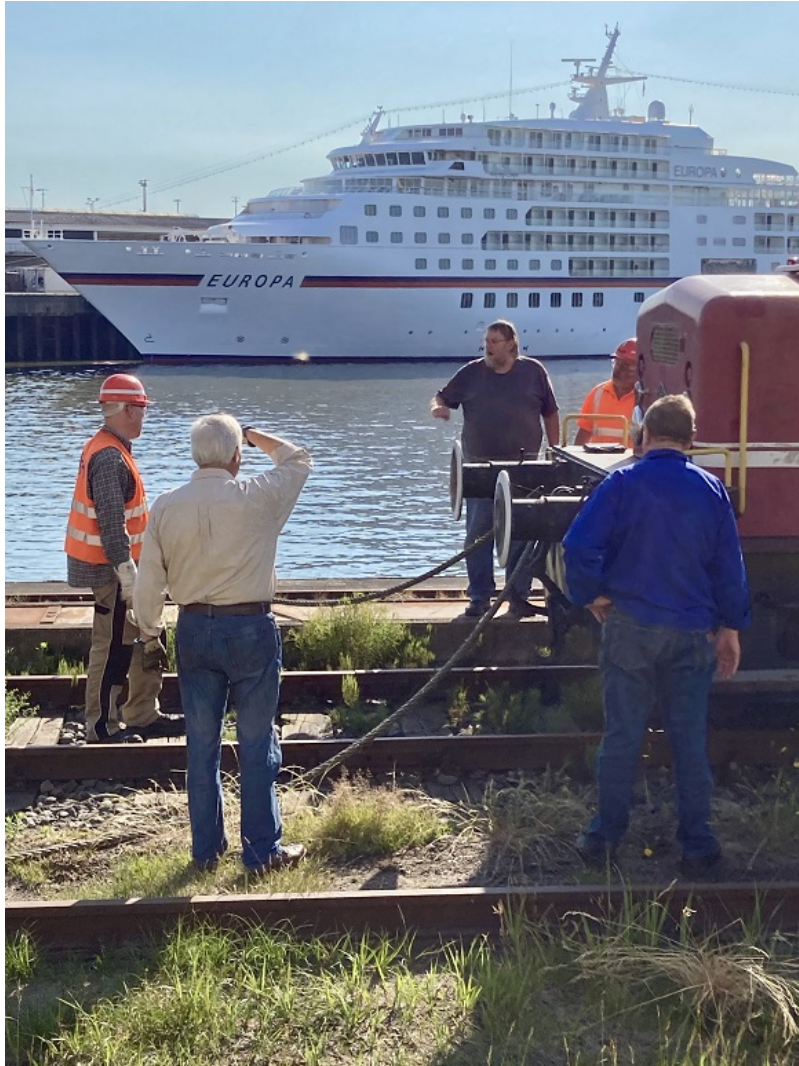
Im Juni 2020 halfen wir mit unserer 221 Hafenbahnlok...