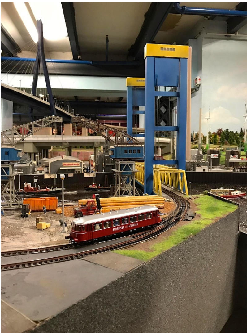
...ins Miniaturwunderland Hamburg ein.