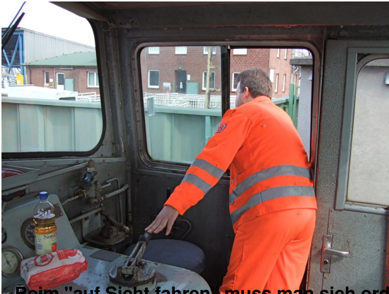
Beim "auf Sicht fahren" muss man sich ordentlich aus unserer Lok hinauslehnen