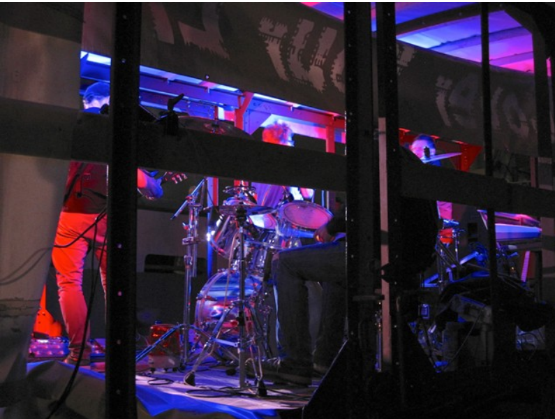
Der Abend unseres 10 Jährigen klingt mit Live-Musik aus