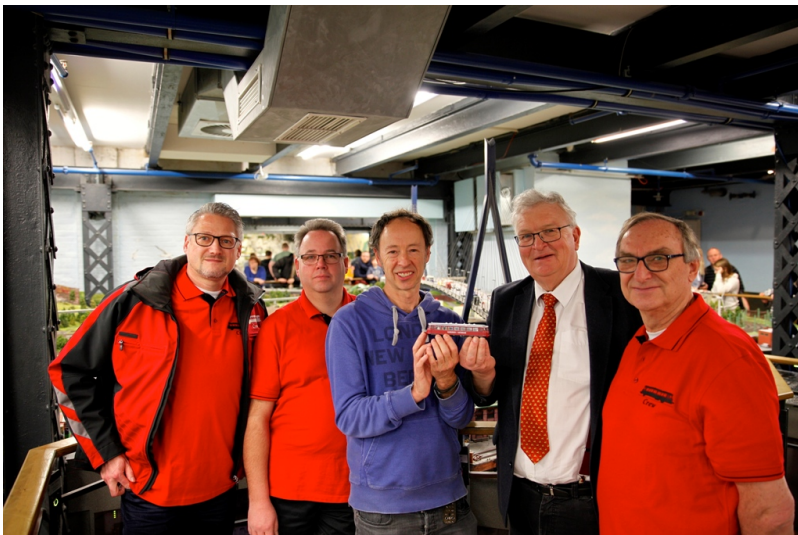
Im Februar 2019 zog ein Modell unseres Fridolins...