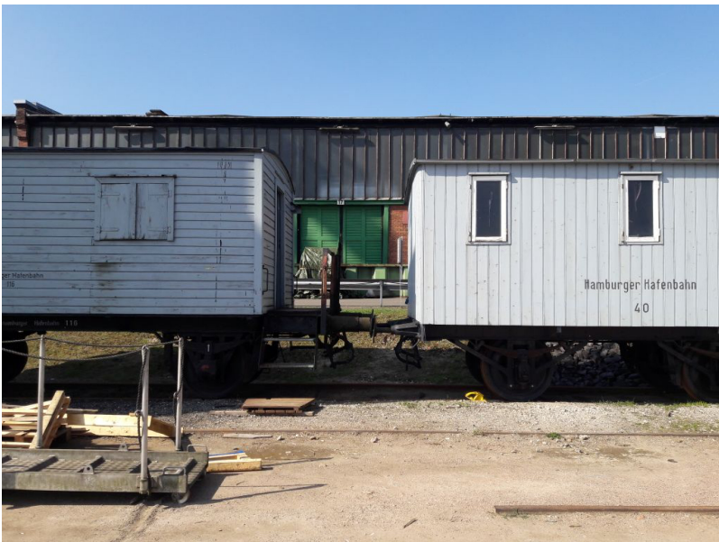
Im Frühjahr 2018 Hafensbahn-Wagen 116 und 40...