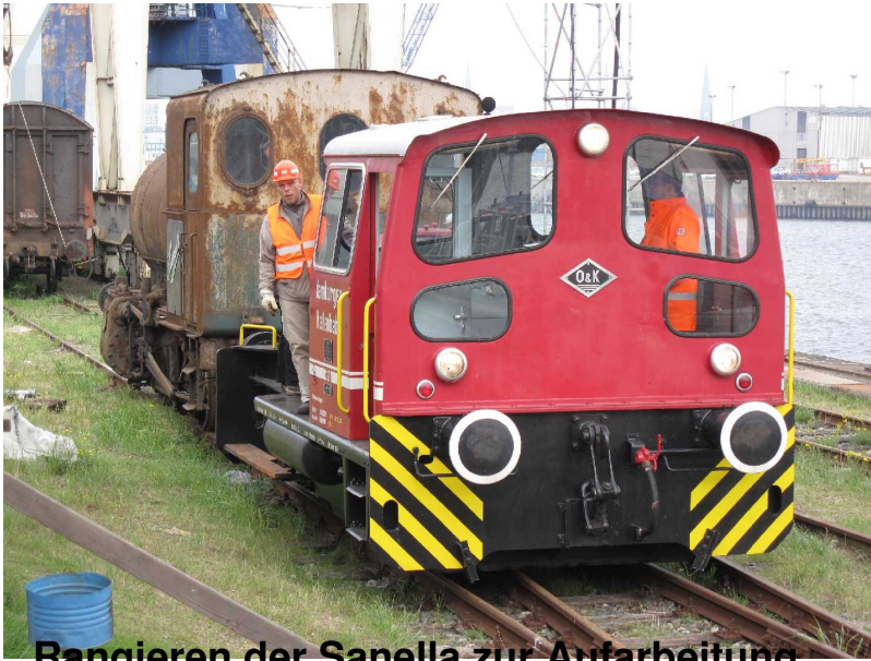
Rangieren der Sanella zur Aufarbeitung