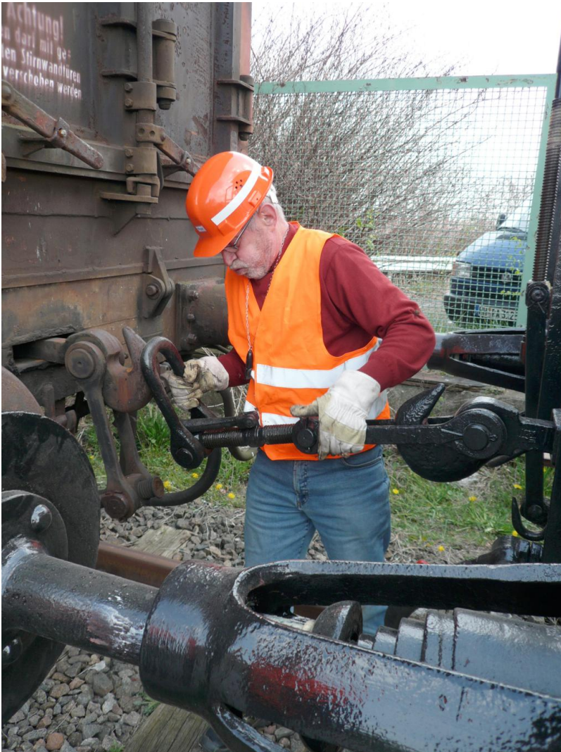
Die Kupplungen sind nicht ganz leicht