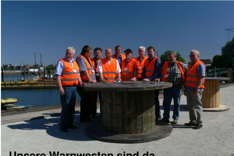
Unsere Warnwesten sind da...