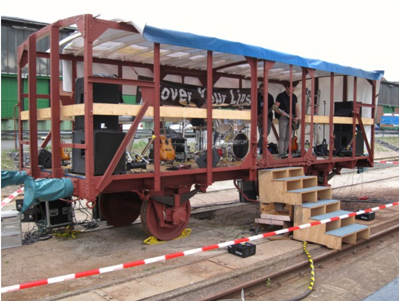
Zu unserem 10jährigen Jubiläum im September 2014 hatten wir die Band "Cover y Mit dem in Aufarbeitung befindlichen Wagen G10 hatten wir nach kleinen Umbaut