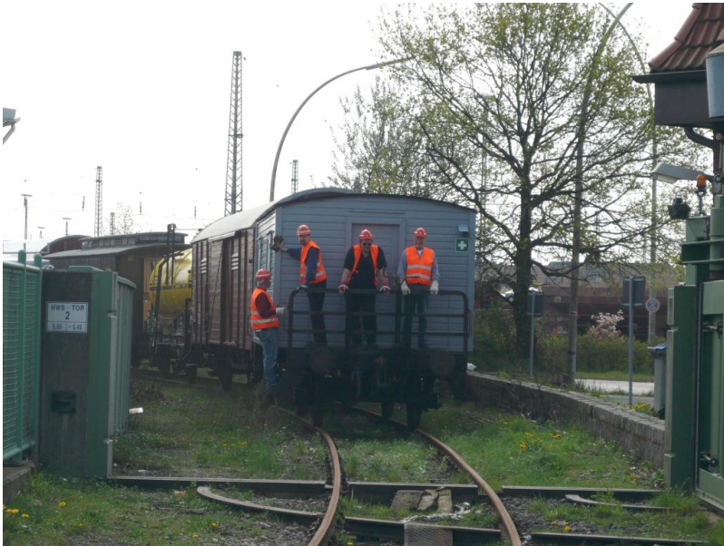
Herbststrangieren ist immer ein Höhepunkt