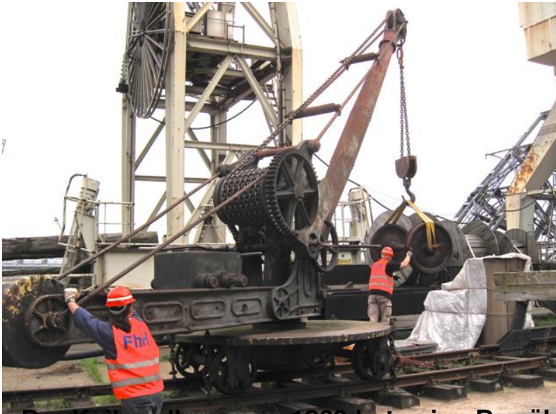
Der Kaihandkran von 1869 hat seine Bewährungsprobe mit 144 Jahren beim Umla