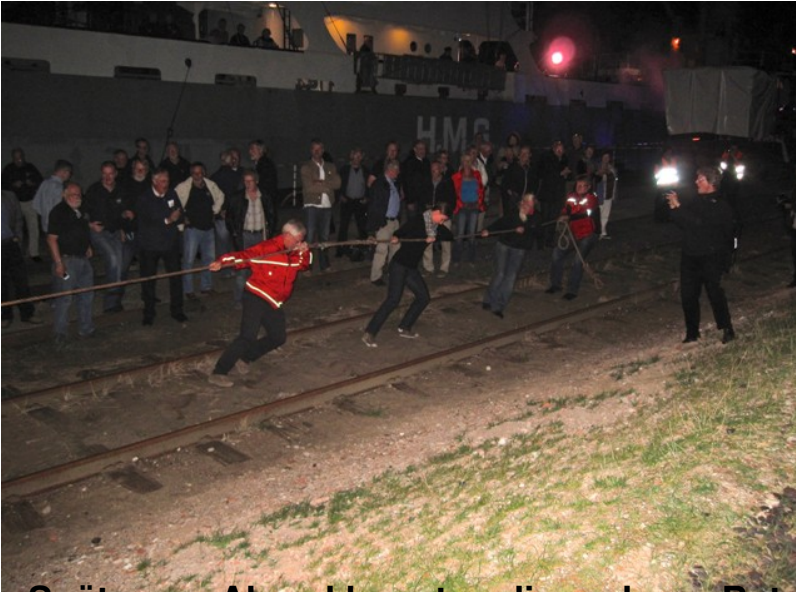
Später am Abend konnten die anderen Betriebsvereine der Stiftung Hamburg Mar