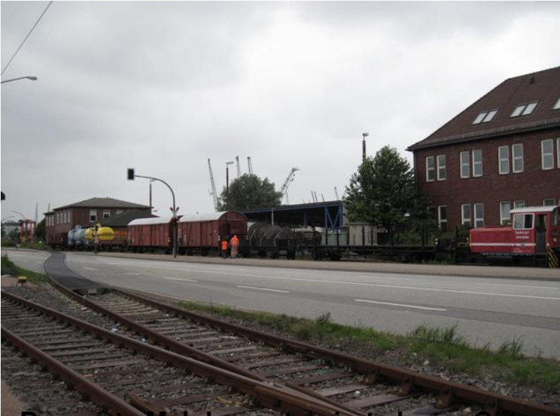
Das erste Mal der restaurierte lange Güterzug am Veddeler Damm