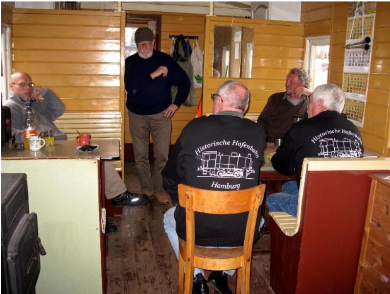
Die Vereinsweatshirts sind da!