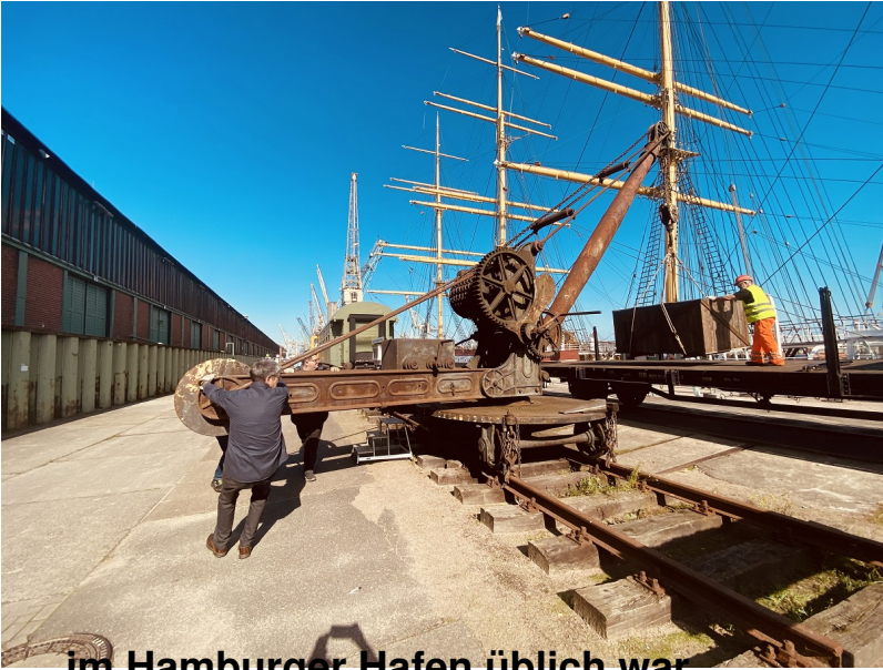
...im Hamburger Hafen üblich war...