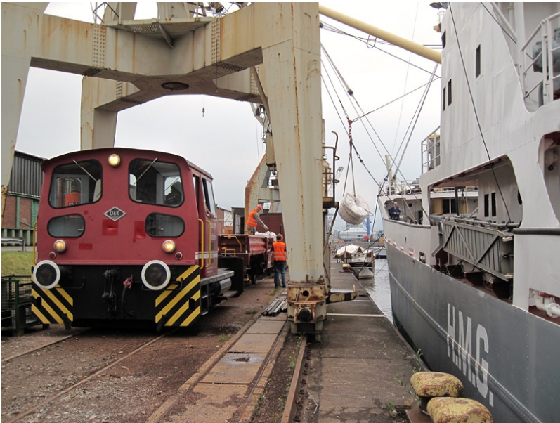
...einer Rolle neues Seil zum Festmachen...