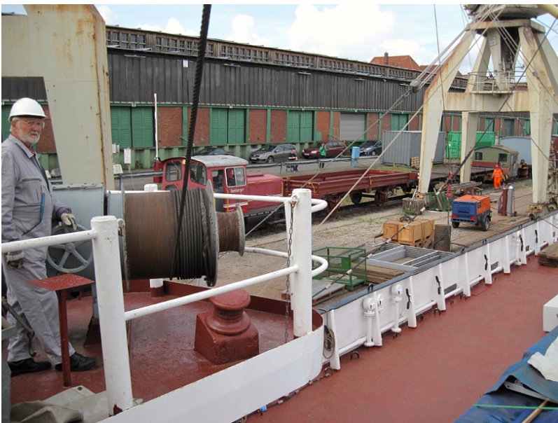
...der MS Bleichen...