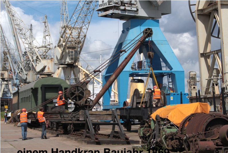
...einem Handkran Baujahr 1869...