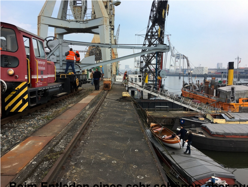
Beim Entladen eines sehr schönen aber auch schweren Holzkanus...