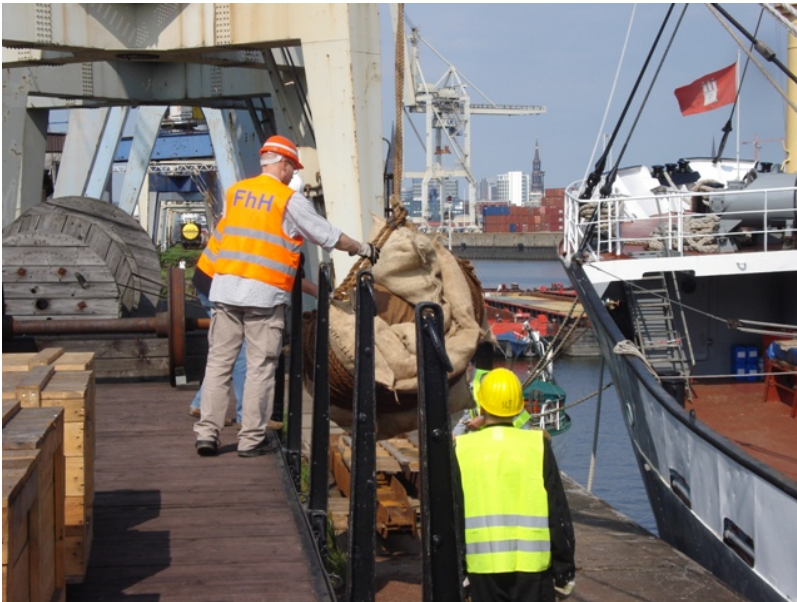
...wie man es heute nur noch selten sieht!