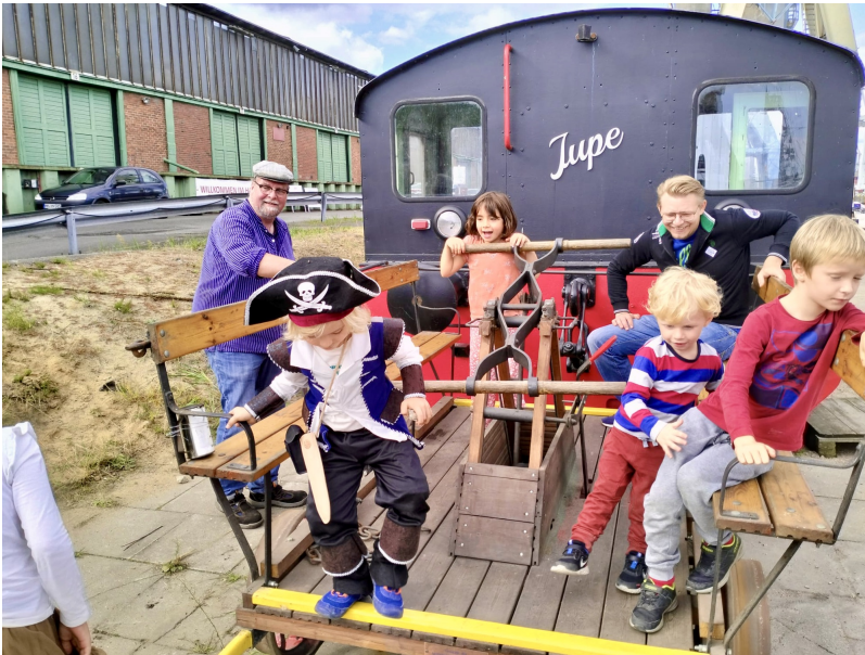
Beim Tag der offenen Stiftung Hamburg Maritim, bei dem sich alle Stiftungsvereine