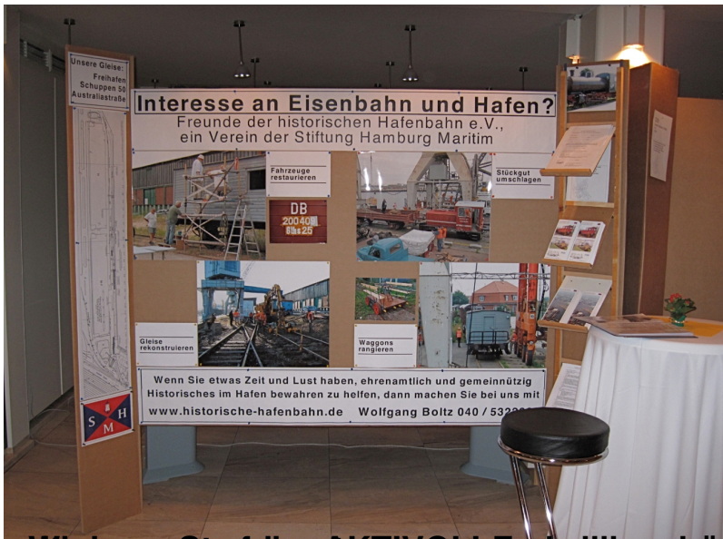
Wie immer sind die AKE/MOLI-Freiwilligenbörse 2011, 2012 und 2013