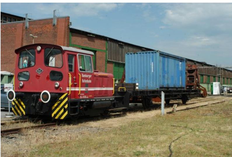
...zum Bremer Kai.