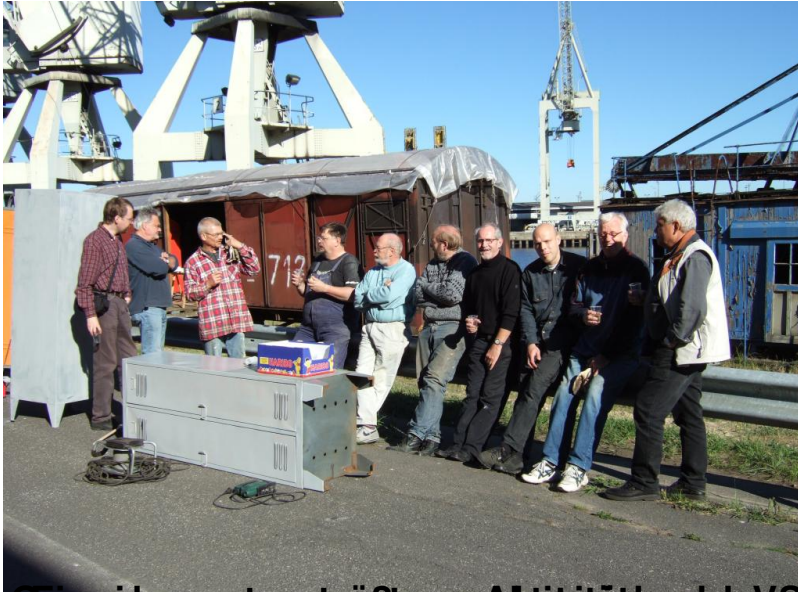
Gemeinsamste größte Aktivität der Vereinsmitglieder der Vereinsgründung