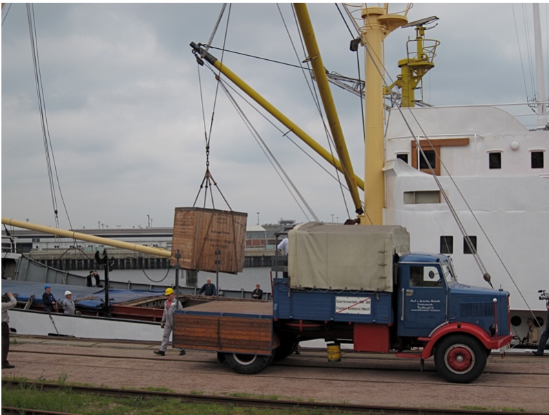
...einem historischen LKW...