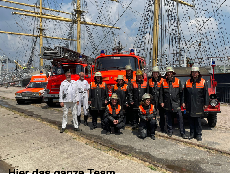
Hier das ganze Team.