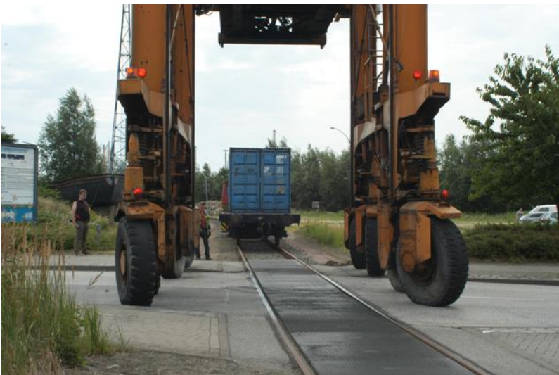
...fährt der "Containerzug"...