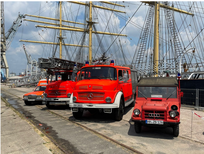
...mit historischen Feuerwehrfahrzeugen zur Verfügung gestellt.