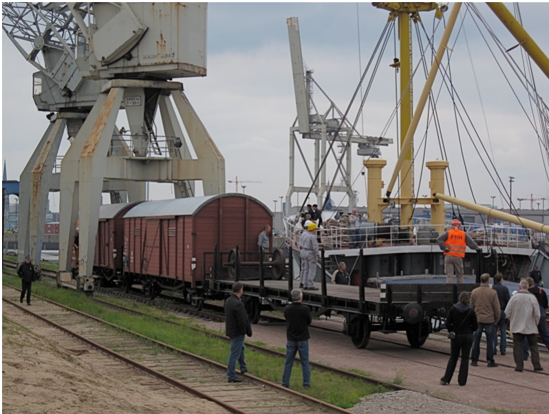
...der historischen Hafenbahn...