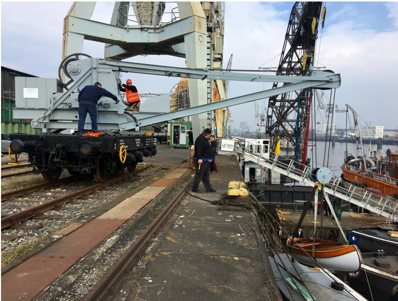
...helfen wir nebenbei gerne mit unserem Schienenkran