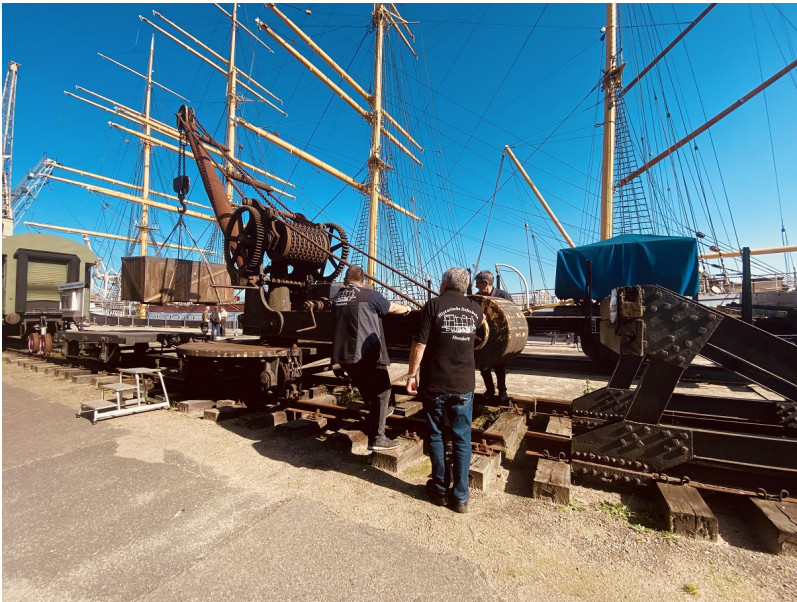
...funktioniert auch heute noch einwandfrei !