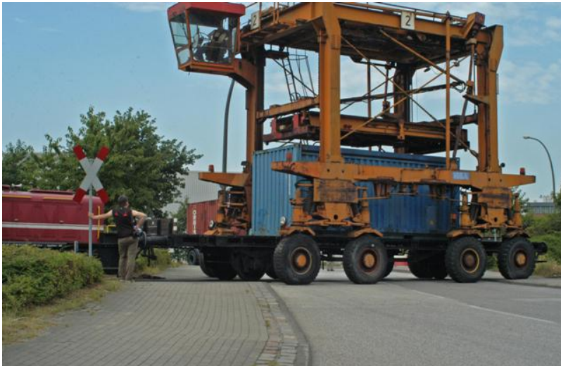
Nachdem die vier Container des Hafenschiffers Container-Ortslagers sind unsere Ränge