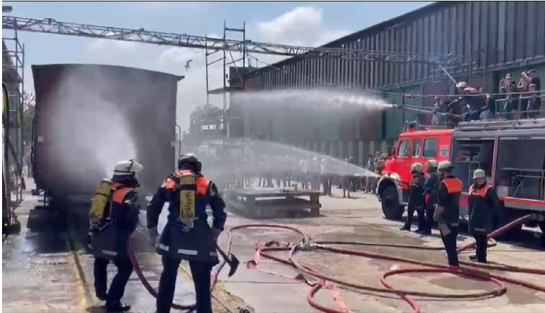
2023 haben wir zwei unserer Waggon für eine Feuerlöschübung...