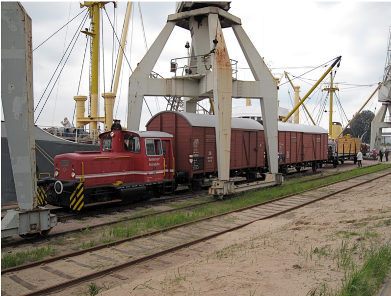
...direkt am Kai mit...