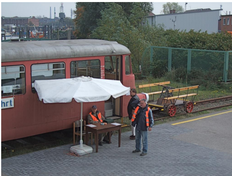
Draisinefahrten werden angeboten