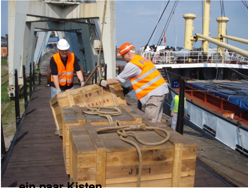
...ein paar Kisten...