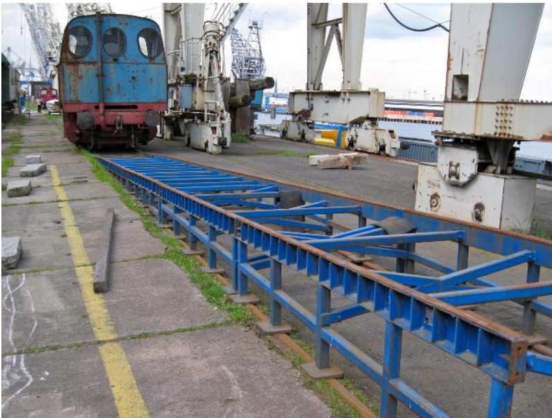
Tiefstack kurz vor dem Abtransport im Mai 2012