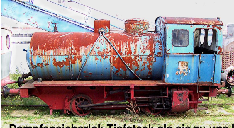
Dampfspeicherlok Tiefstack als sie zu uns kam 2004