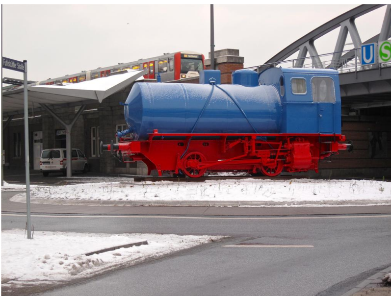
Tiefstack seit dem 12.12.2012 auf dem Kreisverkehr Fuhlsbüttler Strasse Ecke Wie