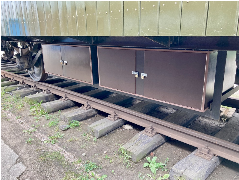
Im Sommer 2021 konnten wir die verbleibenden...