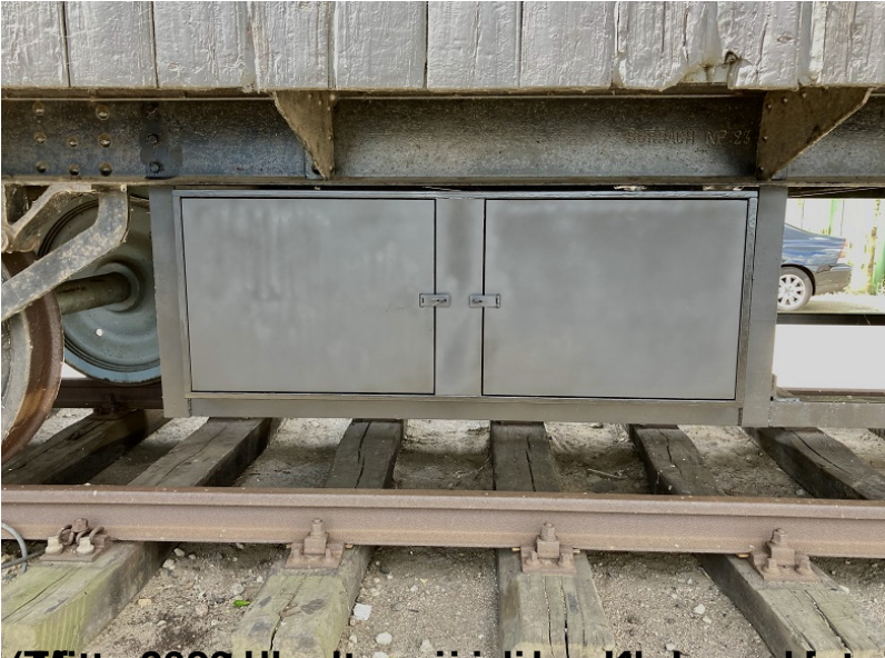
(Mitte 2020 wurde der originale Schuppen, das ursprüngliche Lagerkabinenbetriebsfeld) Die Fr