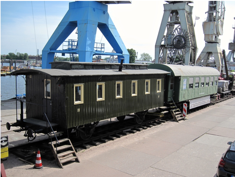
Ende 2017 mit neuen Brettern