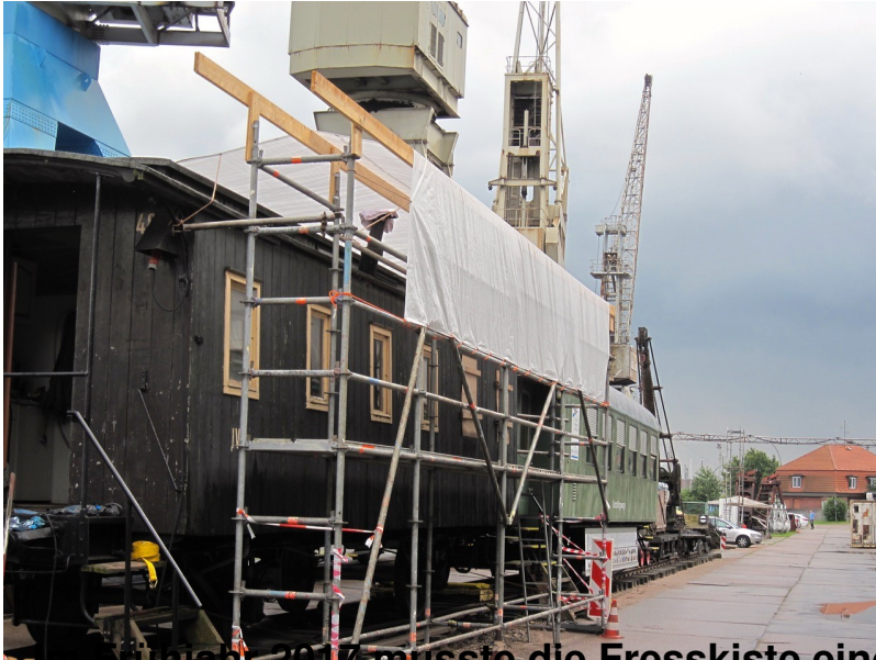
im Frühjahr 2017 musste die Fresskiste eingepant werden, da die landseitigen Br