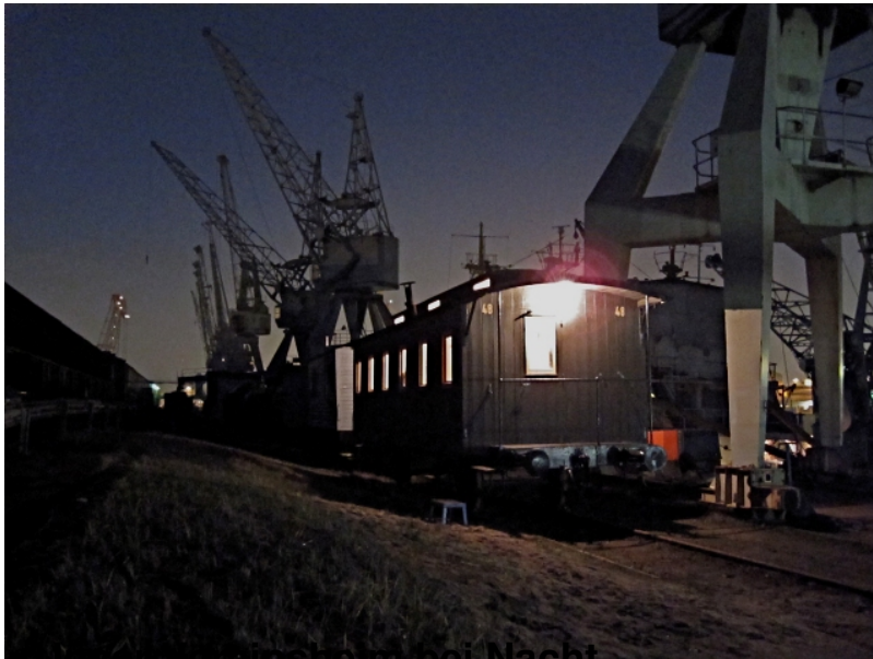
Unser Vereinsheim bei Nacht