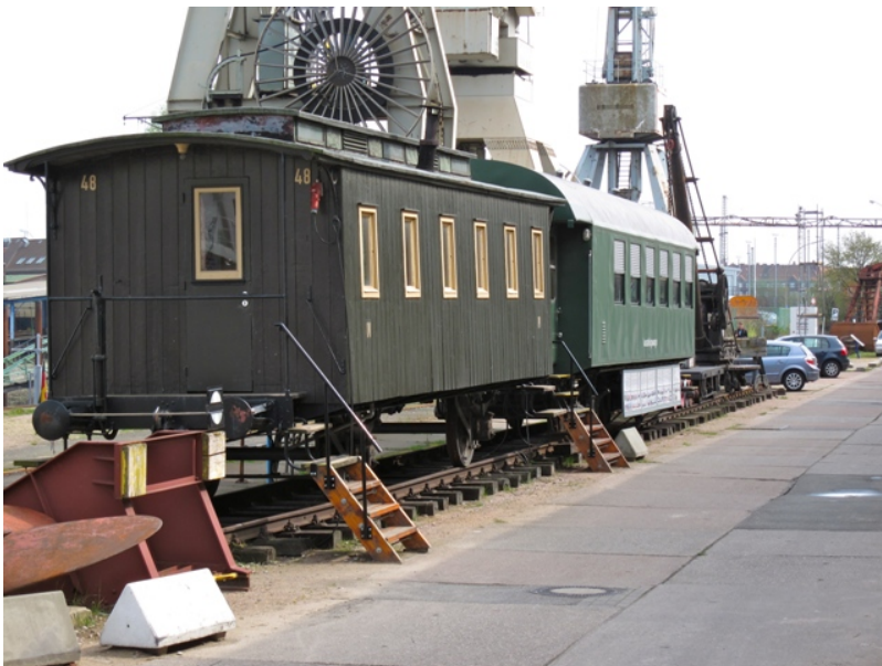
Mit dem Dreiachser auf einem extra Gleisjoch im April 2012