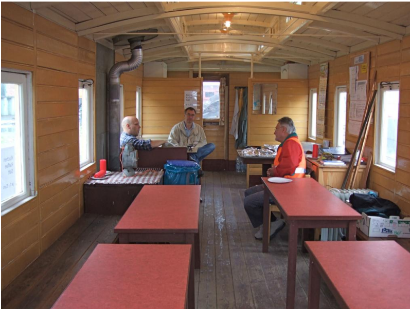
Neue selbstgebaute Tische