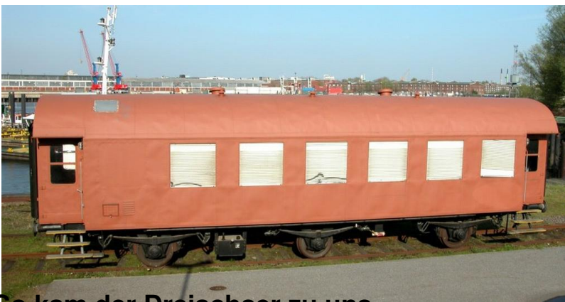
So kam der Dreiachser zu uns