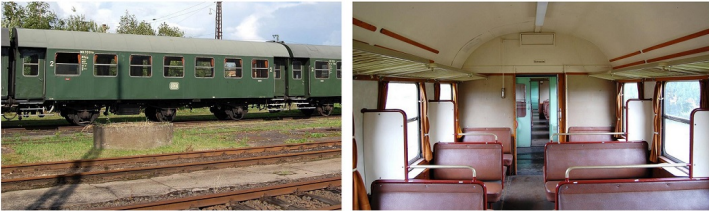
Außen- und Innenansicht eines Umbauwagens 2. Klasse

Unser Ausstellungswagen war früher, ohne Jalousien aber mit 7 Fenstern je Seite und entsprechender Inneneinrichtung, ein Umbauwagen der Deutschen Bundesbahn. Diese Umbauwagen wurden von 1954 bis 1958 unter Verwendung und Veränderung der Untergestelle alter Personenwagen (oft Abteilwagen) neu aufgebaut um den Mangel an Reisezugwagen abzustellen. Der Innenraum gliederte sich in ein Abteil mit 38 Sitzplätzen und ein Abteil mit 24 Sitzplätzen sowie Toilette und Waschgelegenheit. Unser Wagen hat an beiden Enden Rollläden zum Verschließen des Übergangs. Häufig wurden die Wagen jedoch für eine bessere Laufruhe paarweise kurzgekuppelt eingesetzt und hatten dann nur an einem Ende einen Rollladen.