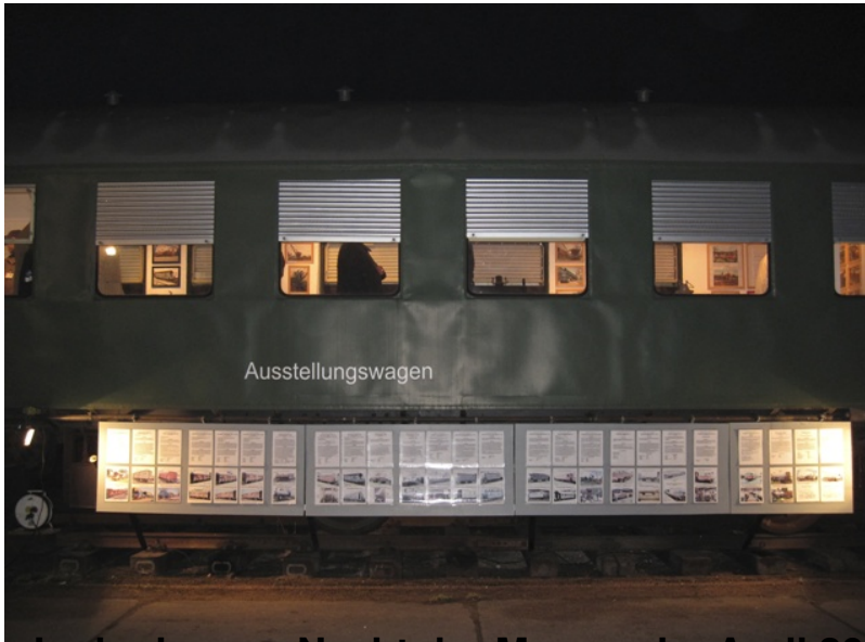
In der langen Nacht der Museen im April 2013