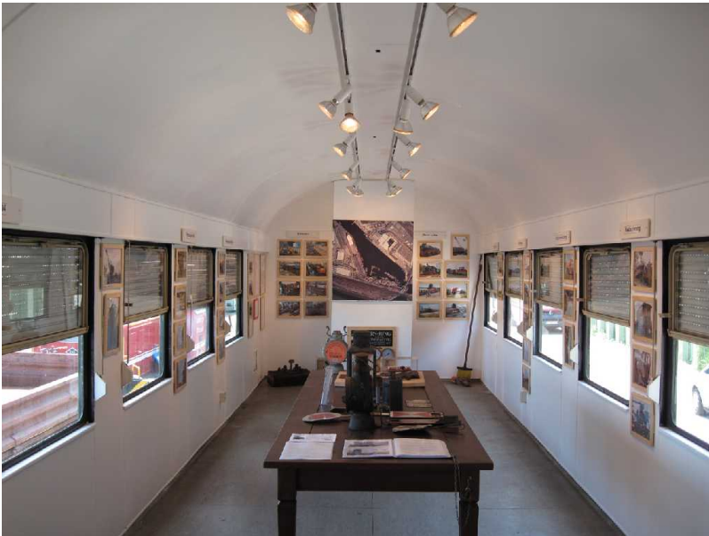
Die Ausstellung ist fertig