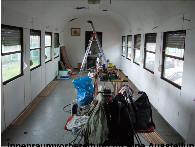
Innenraumvorbereitung für eine Ausstellung