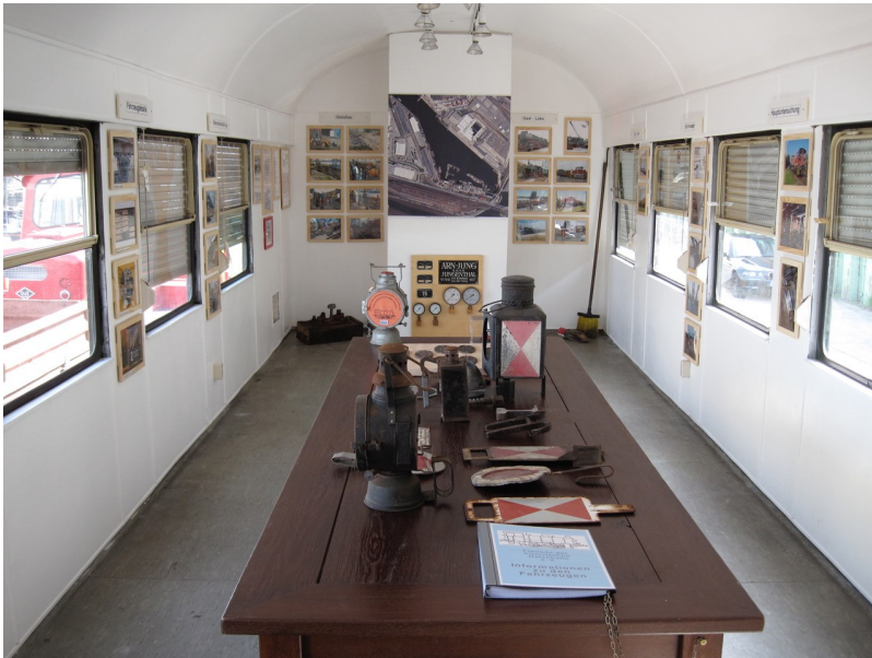
Die Ausstellung 2017