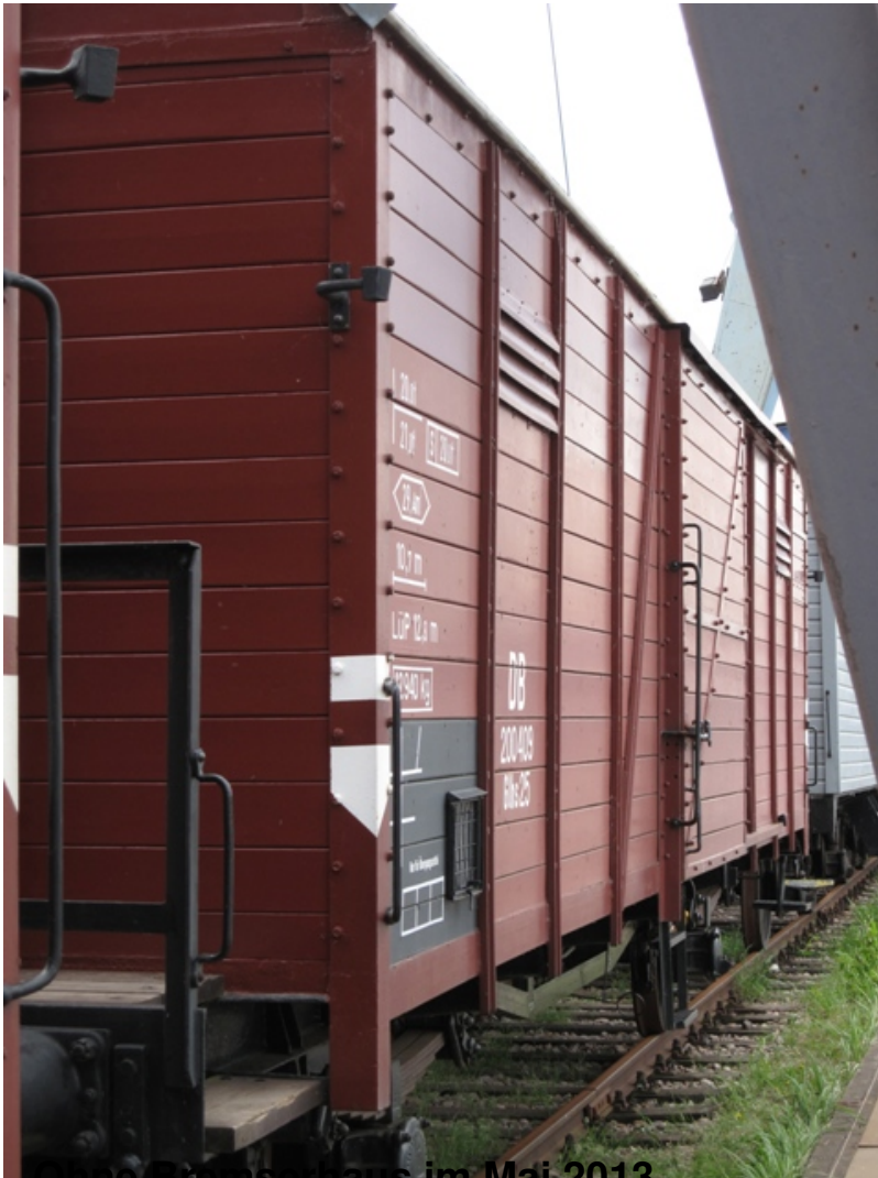
Ohne Bremsenhaus im Mai 2013