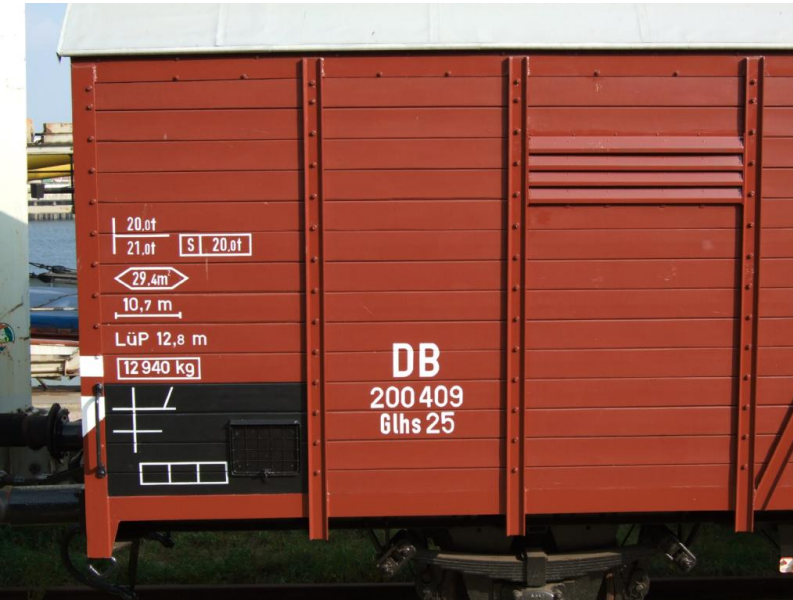
Mit Anschriften fertiggestellt 2009