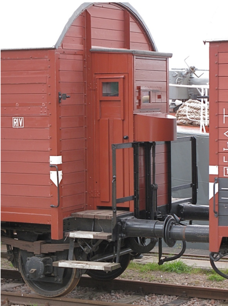
Bremserhaus nun nach Originalplänen 2011 fertiggestellt