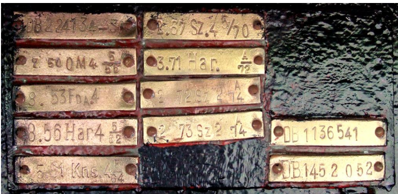
Anschläge am Untergestell