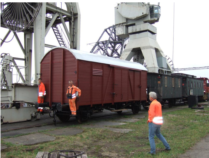
Beplankt, gestrichen und mit neuem Dach beim Rangieren